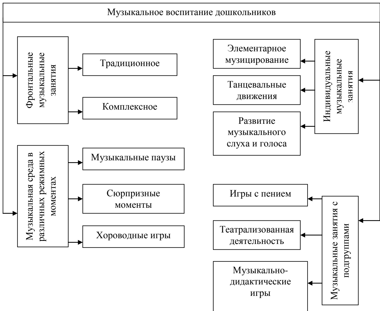
Организация воспитательно-образовательного процесса по музыкальному воспитанию.